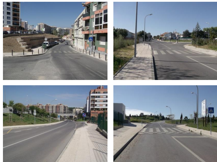
Reportagem da obra realizada