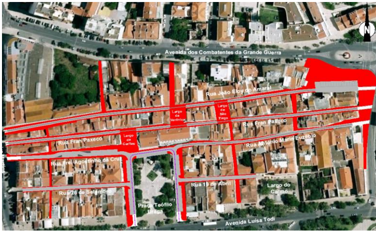
Planta de Localização

O projeto foi desenvolvido de acordo com as normas da EP – Estradas de Portugal, E.P.E. e tendo em consideração as Especificações da Câmara Municipal, sendo o mesmo constituído por vários projetos específicos, nomeadamente, Traçado, Drenagem, Pavimentação, Sinalização, Arranjo Paisagístico e Iluminação, incluindo a realização do Caderno de Encargos.