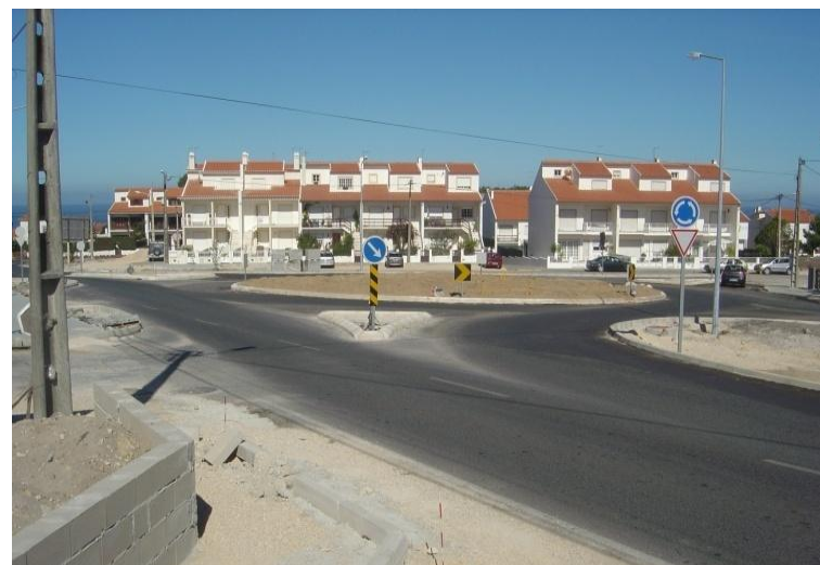
Reportagem na fase final de execução