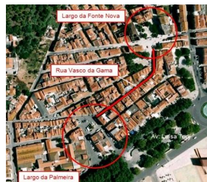
Planta de Localização

O projecto foi desenvolvido de acordo com as normas da EP – Estradas de Portugal, E.P.E. e tendo em consideração as Especificações da Câmara Municipal, sendo o mesmo constituído por vários projectos específicos, nomeadamente, Traçado, Drenagem, Pavimentação, Sinalização, Arranjo Paisagístico e Iluminação, incluindo a realização do Caderno de Encargos.