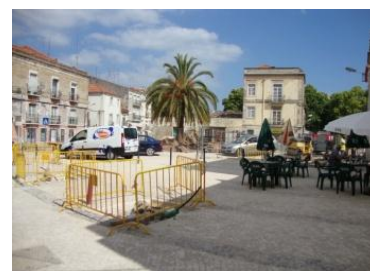
Reportagem na fase final de execução