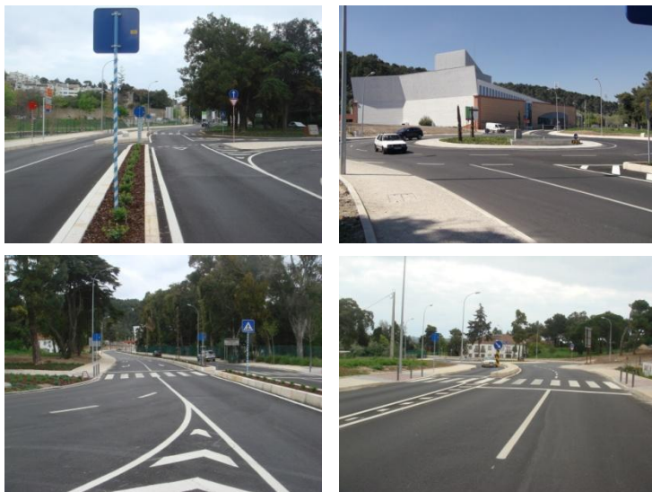
Reportagem da obra realizada