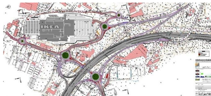
Planta Geral do Traçado