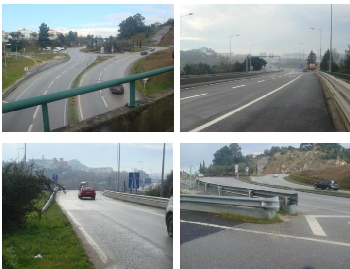
Reportagem do Nó da Gândara