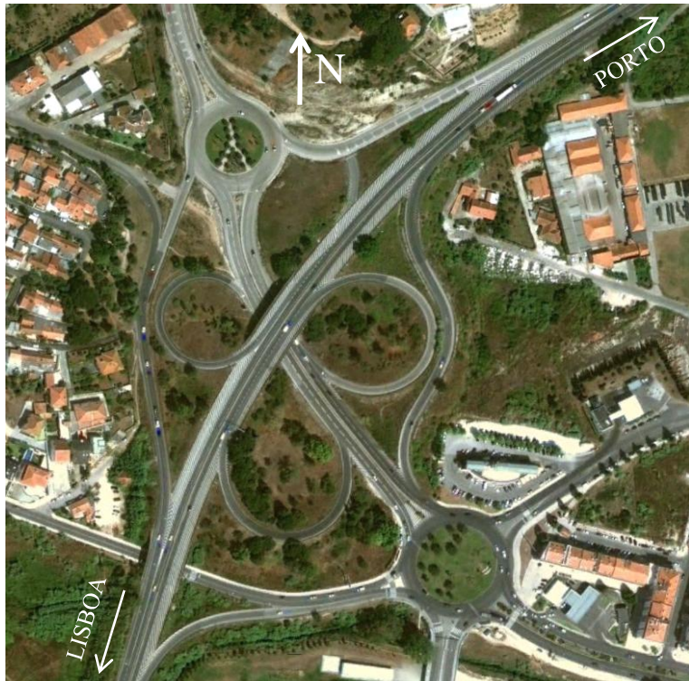
Imagem de satélite do Nó da Gândara

Para além do projecto de Traçado Rodoviário foram também realizados outros projectos específicos, nomeadamente de Drenagem Pluvial, Pavimentação, Sinalização e Equipamentos de Segurança.