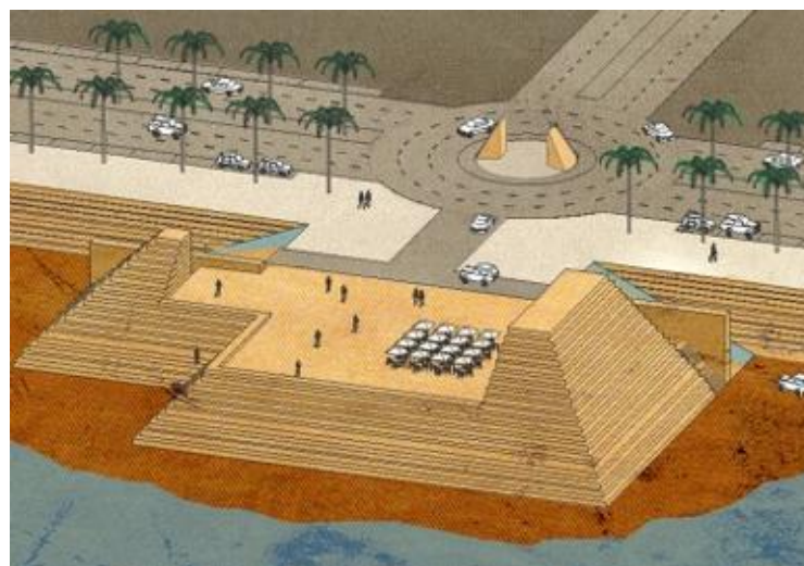
El Nile Street – Pontão tipo

O Projeto de Execução engloba os vários aspetos específicos que foram objeto de análise, nomeadamente Traçado, Drenagem, Pavimentação, Sinalização, Paisagismo e Iluminação.