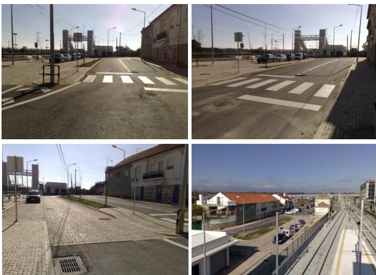
Reportagem da obra executada