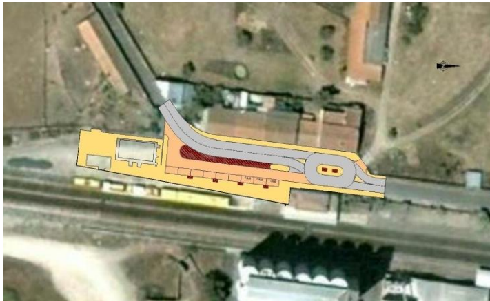
Planta de Localização

O projecto foi desenvolvido de acordo com as normas da EP – Estradas de Portugal, E.P.E., sendo o mesmo constituído por vários projectos específicos, nomeadamente, Traçado, Drenagem, Pavimentação e Sinalização, incluindo a realização do Caderno de Encargos.