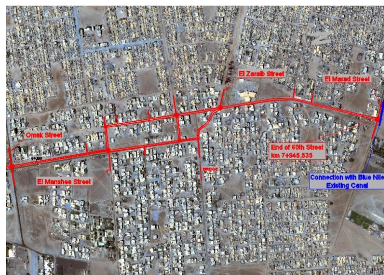
Imagem de satélite da zona final da 60 th Street